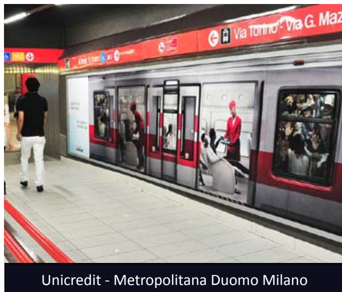
Unicredit - Metropolitana Duomo Milano